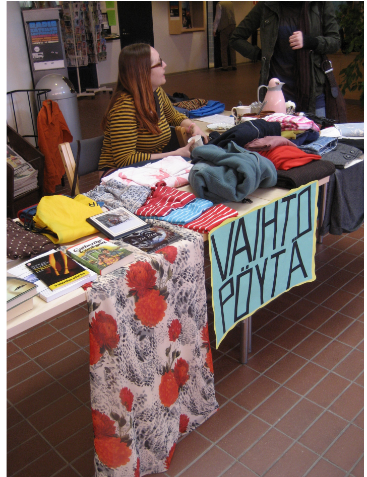
Lapin yliopisto, Rovaniemi