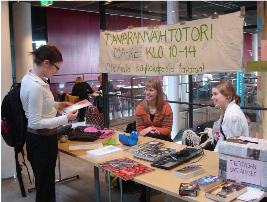
Viikin kampus, Helsinki